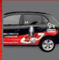
BESCHRIFTUNG UND FAHRZEUGFOLIERUNG