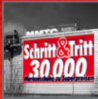
WERBEANLAGEN UND LEITSYSTEME