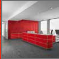
OBERFLÄCHEN UND FLACHGLASFOLIERUNG