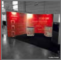
RAUM- UND MESSESYSTEME